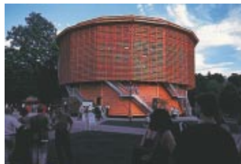
Haller Ansichten: Shakespeare-Theater ...

Die Basis für den Umstieg haben die Hohenloher schon vor Jahren mit der