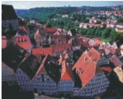
... Altstadt und ...

Software-Lösungen „von der Stange“ sind dadurch zwar für die Haller relativ günstig zu beziehen. Aber gut 70.000 Euro, die die Stadt dieses Jahr für die Lizenzierung von Micro-