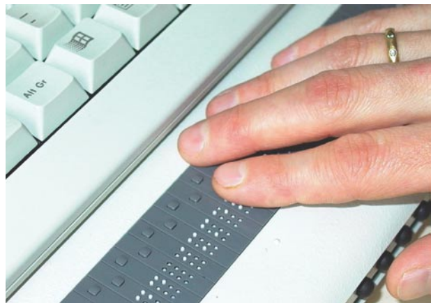
Braillezeilen machen Internet-Seiten lesbar.

Für blinde Internet-Nutzer am ansprechendsten und verständlichsten gestaltet ist die Website der rheinland-pfälzischen Landeshaupt-