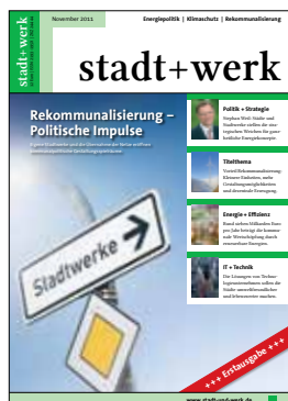
Ausgabe November 2011